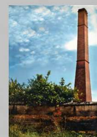
INGENIO DEL TRAPICHE Velez-Málaga